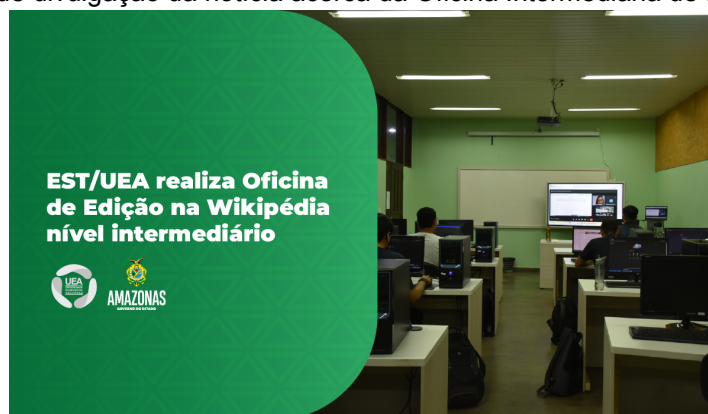
Figura 3 - Banner de divulgação da notícia acerca da Oficina Intermediária de Edição na Wikipédia.

A segunda oficina de edição na Wikipédia, por sua vez denominada Oficina Intermediária (Figura 3), ocorreu no dia 14 de dezembro de 2022, de forma consequente à Oficina Básica.