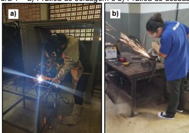
Figura 1 – a) Prática de soldagem e b) Prática de desbaste.