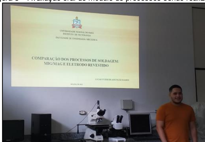
Figura 3 – Avaliação oral do módulo de processos sendo realizada.