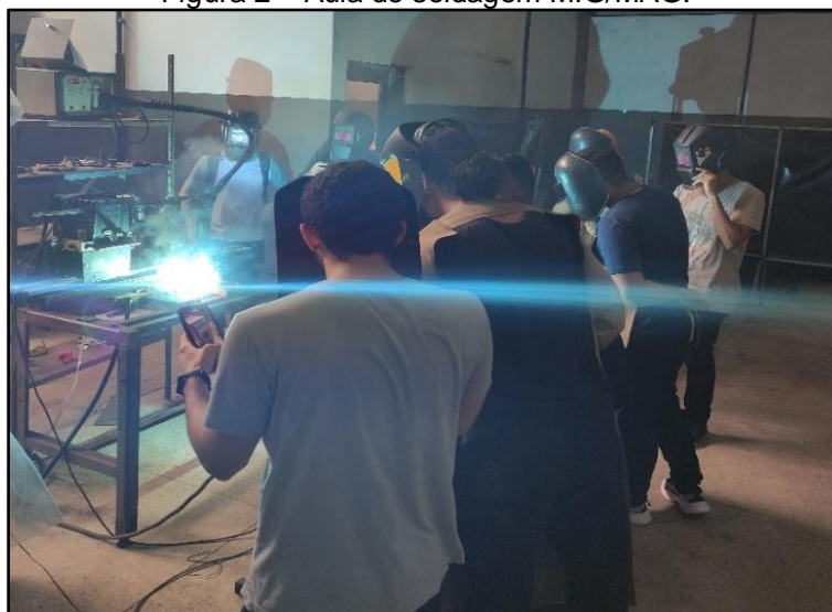
Figura 2 – Aula de soldagem MIG/MAG.

A figura 2 evidencia uma aula prática do processo de soldagem MIG/MAG automatizada ministrada para os alunos do curso.