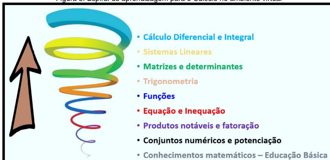
Figura 3: Espiral de aprendizagem para o Cálculo no ambiente virtual