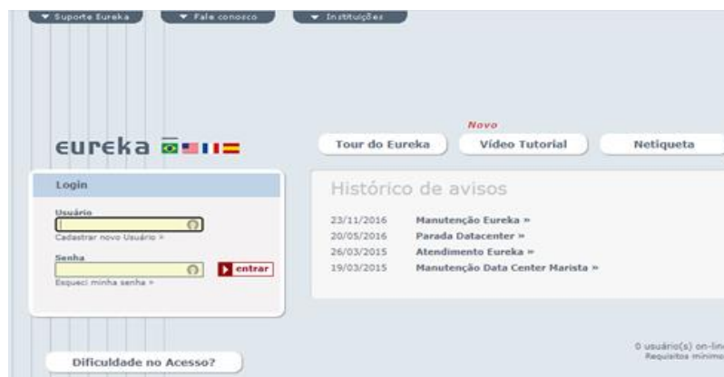
Figura 3 - Apresentação do site Eureka