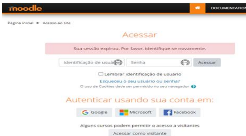
Figura 1 - Apresentação da plataforma do site Moodle