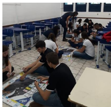
Figura 7: Minicurso Bolsa Mineral.