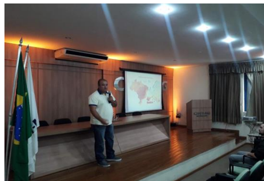
Figura 9: Palestra Eficiência Energética.