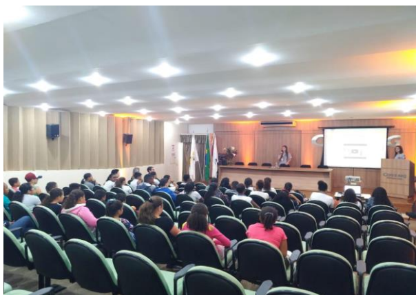
Figura 10: Palestra Conscientização de Crianças Quanto ao Uso de Energia.