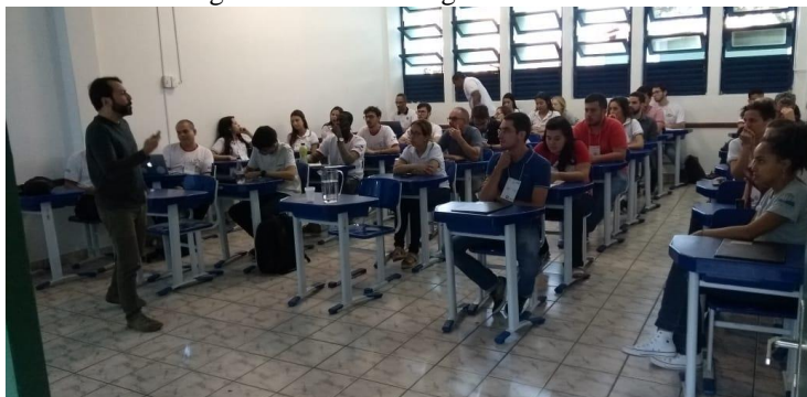
Figura 5: Palestra Programa Futura-se.