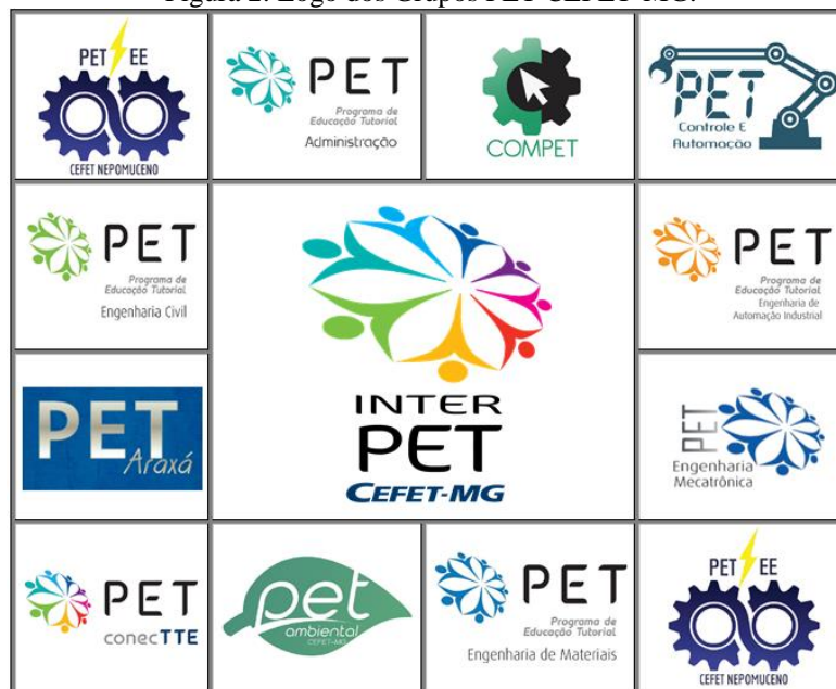
Figura 2: Logo dos Grupos PET CEFET-MG.

O mosaico abaixo mostra os logos de todos os grupos PET presentes na instituição, inclusive o logo oficial do InterPET CEFET-MG.