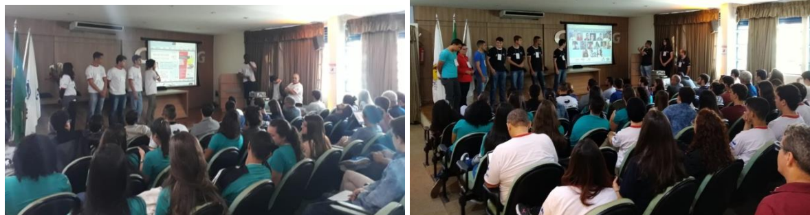
Figura 3: Apresentação de Resumos.

Após a avaliação dos resumos todos os grupos tiveram pelo menos 1 trabalho selecionado. A apresentação foi realizada de forma oral sendo possível a utilização de dispositivos de simulação, vídeos e amostra de protótipos.