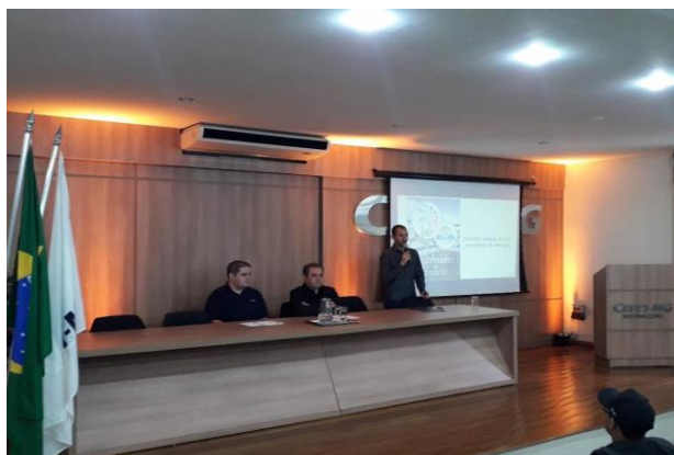
Figura 11: Mesa redonda