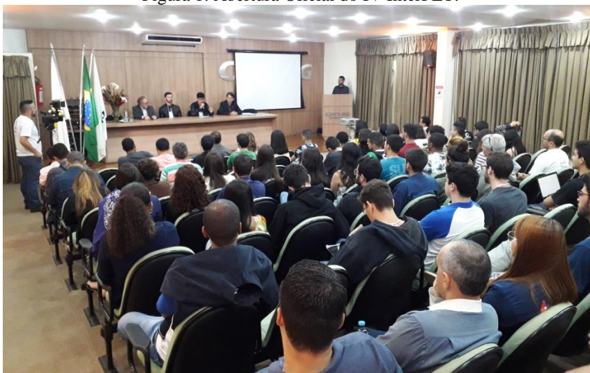
Figura 1: Abertura Oficial do IV InterPET.

Durante a quarta edição do InterPET, realizado pelo PETEE no Campus Nepomuceno, ocorreram várias atividades como a apresentação de artigos e atividades executadas por cada grupo PET durante o ano além de palestras e minicursos.