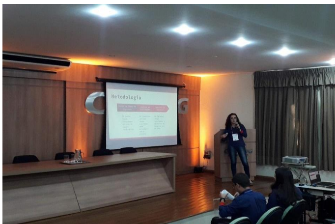
Figura 13: Apresentação de Grupos PETs.