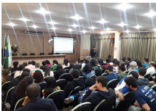
Figura 8: Palestra Programa de Educação Tutorial.