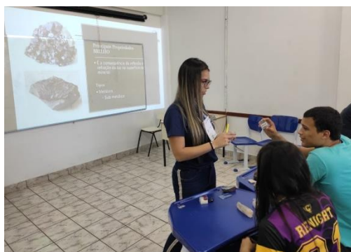
Figura 6: Minicurso Identificação Mineral.