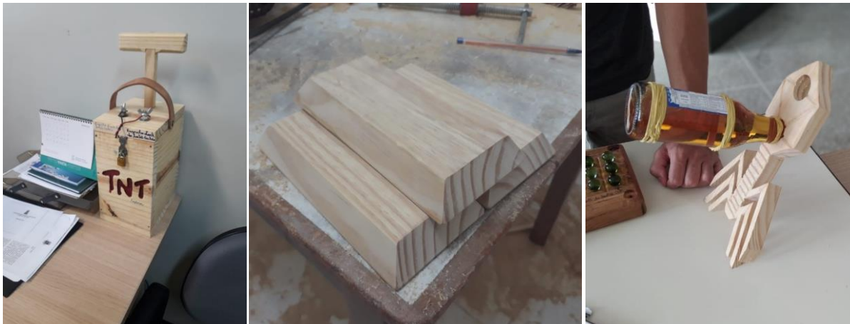
Figura 4 – Peças artísticas: urna de votação (esquerda), barras de ouro de madeira (centro), suporte mágico de garrafa (esquerda).