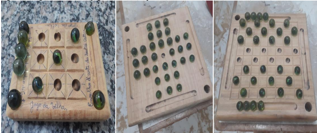
Figura 2 –Jogos de tabuleiro:jogo da velha (esquerda), resta um (centro), dama (direita)