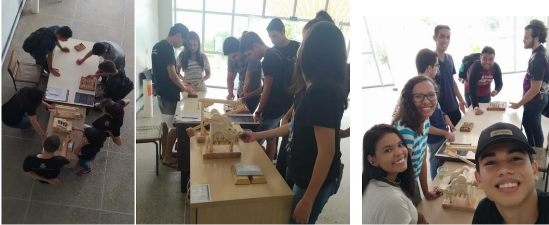
Figura 5 – Interação da comunidade acadêmica com as exposições.