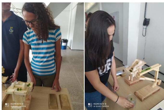
Figura 7 – Jogos de tabuleiro em uso.