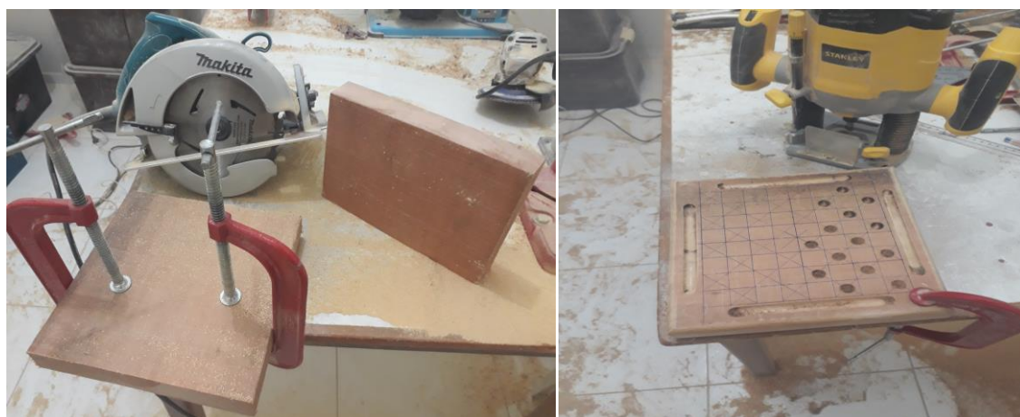
Figura 1 – Construção dos jogos de tabuleiro.

A primeira atividade foi pensada para explorar a interação entre os alunos que muitas vezes ficam sozinhos. Desta forma, os bolsistas sugeriram a construção de jogos e o coordenador sugeriu jogosde tabuleiros, pois são fáceis de transportar e de aprender. Com isso, se utilizou das ferramentas do campus , Figura 1, e os alunos construíram três jogos, Figura 2, estes são: jogo de dama, resta um e jogo da velha.