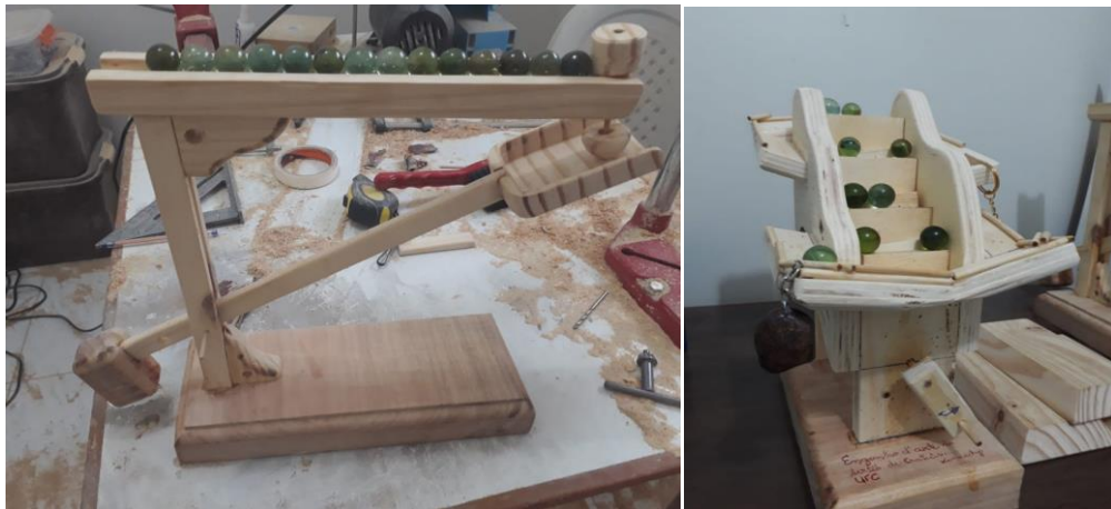
Figura 3 – Brinquedos engenhocas construídos

A segunda atividade foi pensada para valorizar os espaços no sentido de a comunidade acadêmica poder brincar em locais comuns, como a portaria. Assim, foram construídas engenhocas que utilizaram o conhecimento de engenharia dos alunos e os materiais disponíveis localmente, Figura 3.