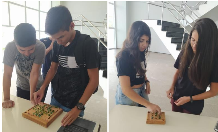
Figura 6 – Jogos de tabuleiro em uso.

A primeira ação foi a exposição no Hall de entrada dos jogos de tabuleiro: dama, resta um e jogo da velha, Figura 6. Esta ação teve como resultado uma grande procura por grupos de alunos que interagiram de forma competitiva nos intervalos das aulas. Além disso, as peças contribuíram com: a diversão, distração, raciocínio lógico, cooperação, convívio social.