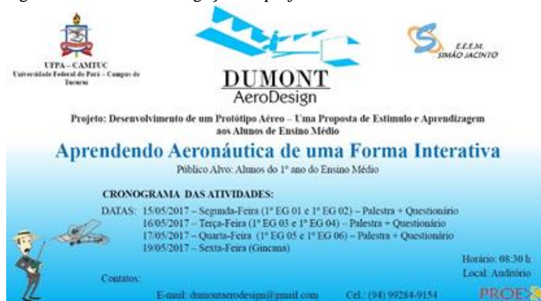
Figura 1 - Cartaz de divulgação do projeto