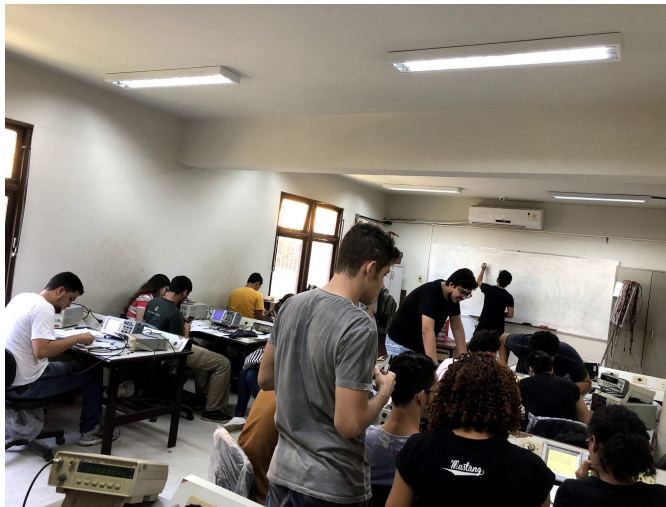
Figura 1 - Alunos usando os equipamentos para testar seus circuitos.

A cada aula de laboratório é proposto para o aluno a montagem de apenas um sub-circuito implementado em protoboard, no qual devem ser analisadas algumas variáveis dos componentes projetados, fazendo uso de equipamentos como o osciloscópio, gerador de funções, protoboard, componentes como resistores, capacitores e amplificadores, além de fonte de alimentação e cabos, como está ilustrado na Figura 1. As análises podem variar de acordo com o roteiro proposto.