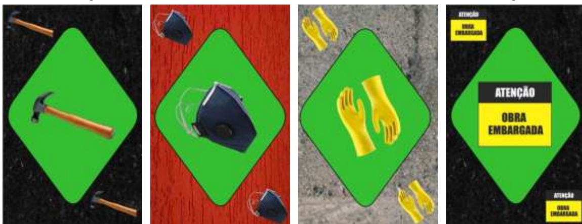
Figura 2 – Cartas exclusivas (Martelo, Máscara, Luva de Inversão e Obra embargada)

A Figura 2 mostra estas quatro últimas cartas. A carta Martelo e a carta Obra embargada estão no naipe Granito, a carta Máscara está no naipe Grafiato e a da Luva de Inversão está no naipe Concreto.