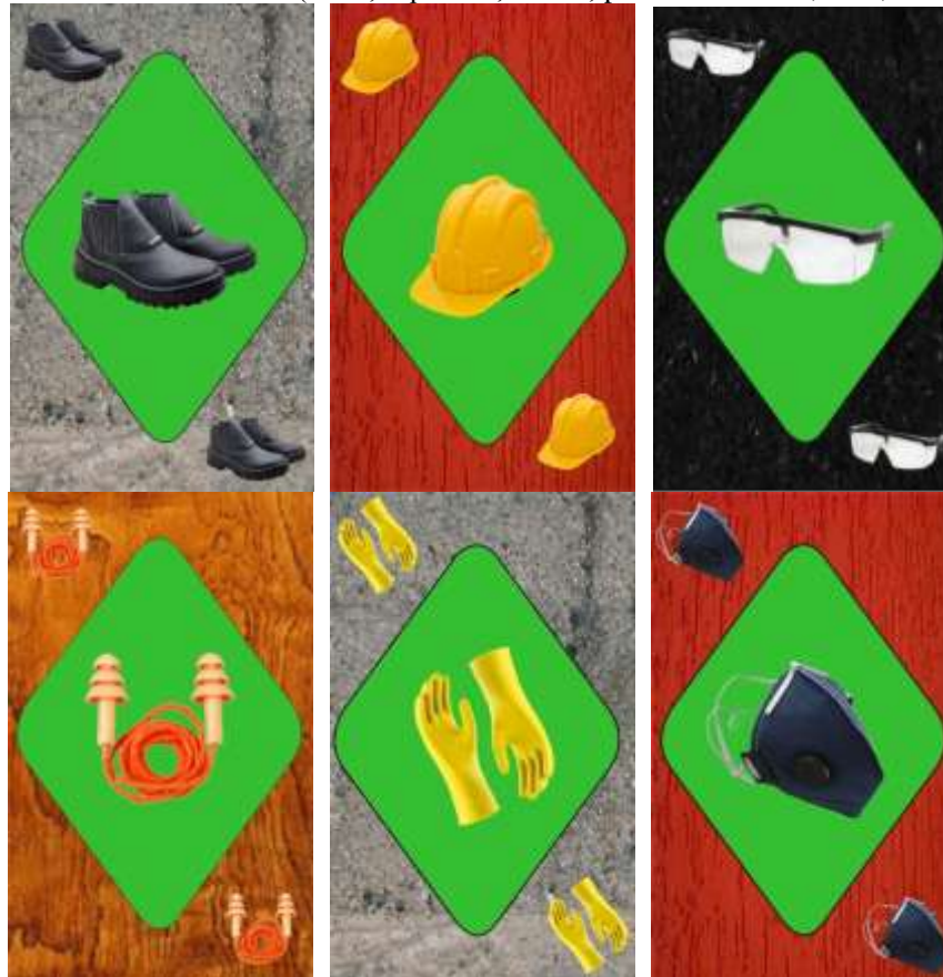
Figura 3 – Cartas com EPI's (botas, capacetes, óculos, protetor auricular, luvas, máscaras)