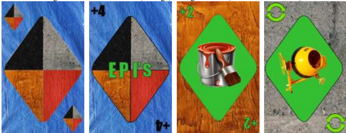
Figura 1 – Cartas exclusivas (Coringa, Coringa EPI's +4, Tinta +2 e Betoneira)