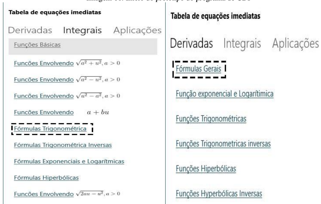
Imagem 01: Início do protótipo do programa de CDI

1. Inicialmente, o discente poderá escolher na tabela de equações imediatas relacionadas a derivadas, integrais e algumas aplicações. Como mostrado na imagem 01, cada opção citada contará com um distintas funções relacionado ao conteúdo desejado, por exemplo em funções básicas o aluno terá uma visão do termo geral da função.