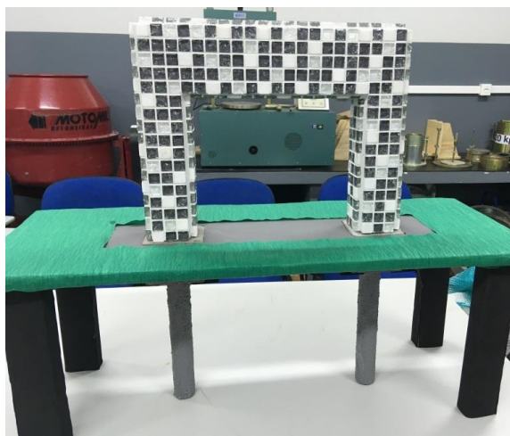
Figura 4 – Pórtico revestido pelos alunos

Outra habilidade desenvolvida foi a definição do tipo de impermeabilização adequada para aquela fundação.