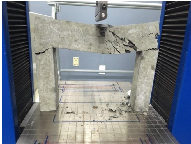
Figura 3 – Viga fissurada e rompida