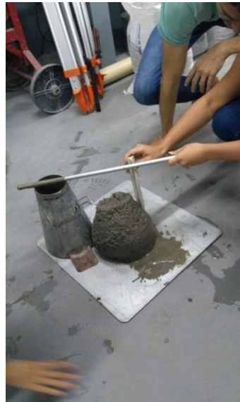
Figura 2 – Concreto produzido pelos alunos para concretagem da viga

traço. As equipes produziram o concreto no laboratório, conforme Figura 2, moldaram corpos de prova e os romperam para verificar a resistência do concreto. Este mesmo concreto foi utilizado para a confecção dos pórticos.