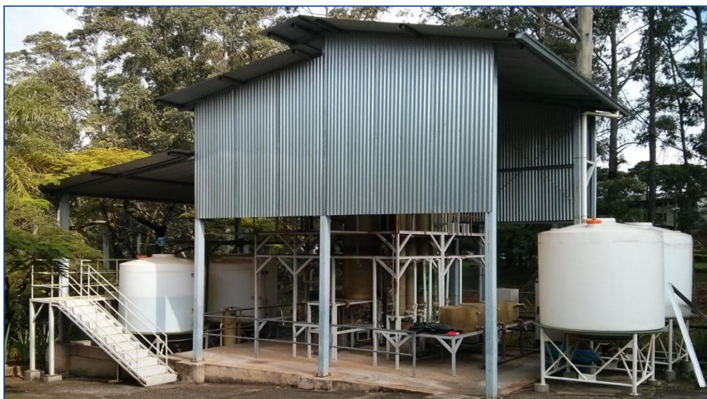
Figura 2 - Instalação Piloto (IP).