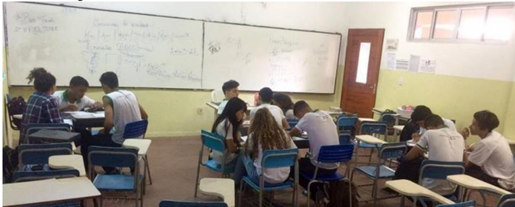
Figura 1 - Células de matemática sobre conversão de unidade de medida.

Durante o processo descrito anteriormente, foi possível perceber que os alunos iam se enquadrando no ideal cooperativo de forma gradativa. No início, demandava-se muito tempo para enfatizar passos essenciais para que a metodologia fosse inserida plenamente. Com o passar dos encontros, os discentes agiam cooperativamente de forma natural, sem a necessidade de maiores intervenções. A figura 1 demonstra como os encontros ocorreram.