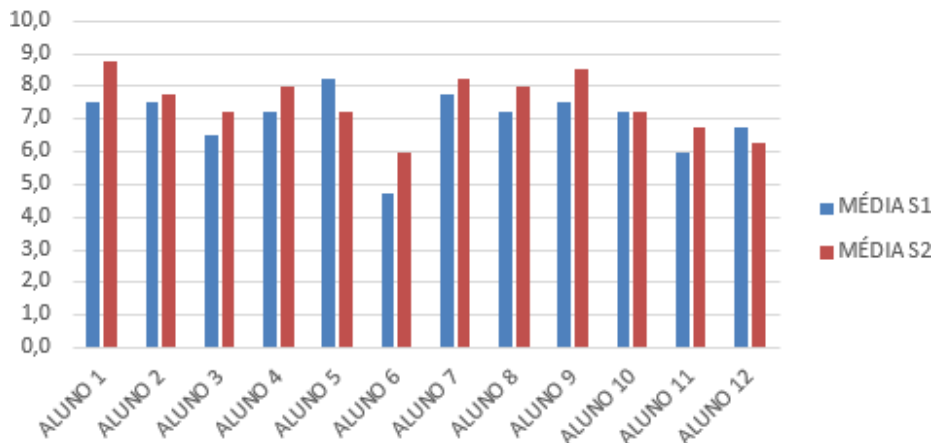
Gráfico 1 – Médias do 1º e 2º semestre da turma A COMPARATIVO DE MÉDIAS DOS SEMESTRES 1 E 2 (TURMA A)

O Gráfico 1 expõe o rendimento acadêmico dos estudantes da turma A na disciplina de matemática. As médias semestrais de cada aluno são postas em contraste com relação ao desempenho durante o primeiro e o segundo semestre de 2017.