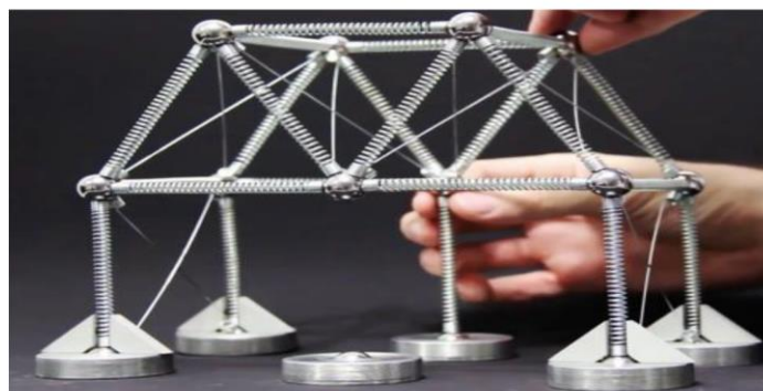
Figura 02 – Modelo Estrutural da treliza Warren