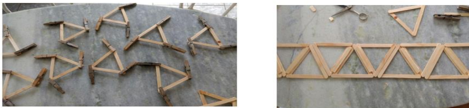
Figura 3: Treliças com palitos de picolé

A partir de cada barra, construiu-se 15 triângulos equiláteros em cada lado da ponte. No modelo final construído, foram utilizados 338 palitos de picolé. Seu comprimento final é de 96,0 cm, altura de 11,5 cm e largura de 13,5cm, conforme demonstram as figuras seguintes: