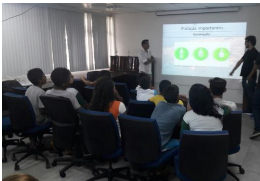
Figura 3.b – Apresentação da maquete para as crianças na Eletronorte