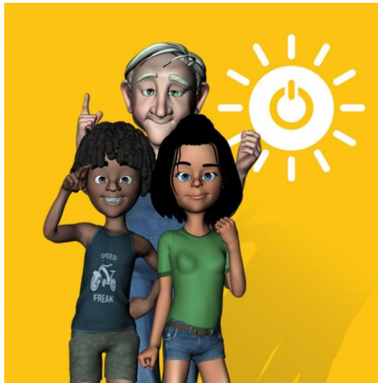
Imagem 4 – Ilustração dos protagonistas da história

A novidade com relação a nova maquete está direcionada a adicionar conceitos de eficiência energética e conforto ambiental, apresentar conceitos introdutórios no sentido do entendimento que a projeção do espaço não conduza a uma impressão negativa na área onde se construiria, mas que a residência trabalhasse juntamente com a área para lograr a melhor resposta na procura de condições de vida adequadas. Conceitos básicos e importantes na qualidade e conforto ambiental, como, por exemplo, aproveitamento de arborização no entorno. Como cita Romero (2000; p. 47): “O espaço produzido deve manter estreitos laços com o entorno, procurando uma posição de equilíbrio ecológico autorregulado com este, minimizando assim o impacto da intervenção no meio”.