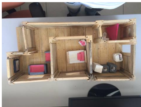
Figura 2.b – segunda versão da maquete