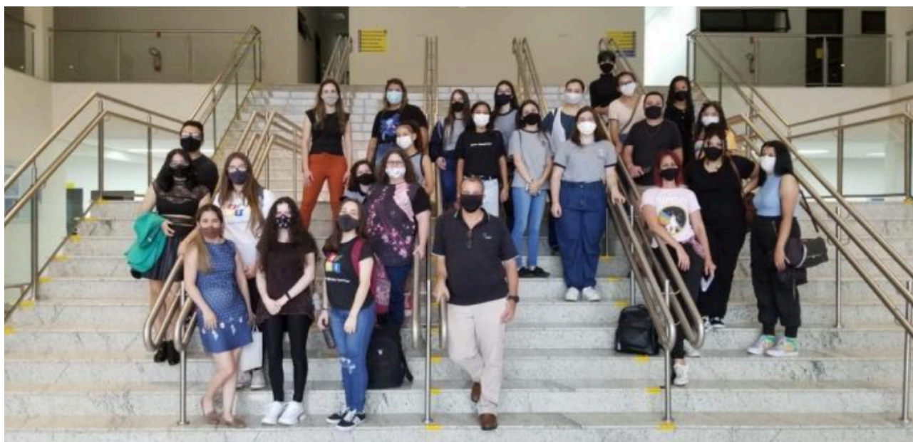
Figura 3 – Participantes Meninas na Tecnologia 2021