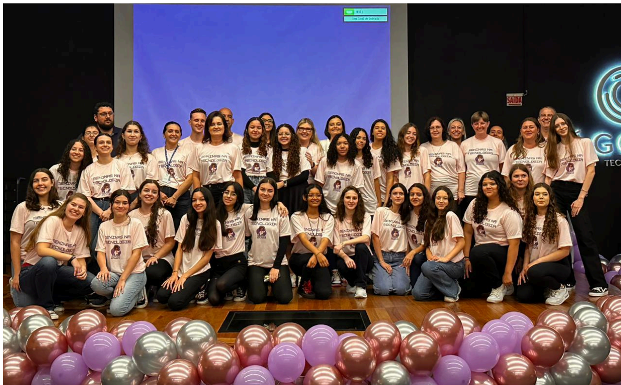
Figura 6 – Finalistas do projeto Meninas na Tecnologia