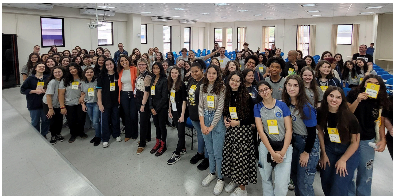
Figura 5 – Participantes da Mostra de Ciências