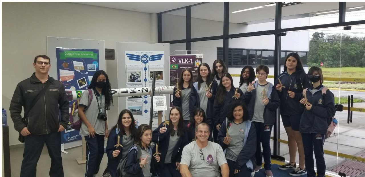
Figura 4 – Visitas ao ECT

Fonte: Projeto Meninas na Tecnologia, 2022.