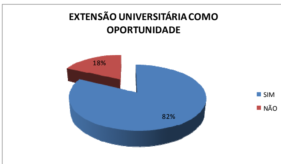
Figura 4: Extensão Universitária como oportunidade.

Questionados sobre as possíveis oportunidades que o projeto de extensão trará para os seus envolvidos, 82% dos entrevistados acreditam em grandes oportunidades. Estes resultados remetem à confiança depositada dos alunos que disseram ter conhecimento da extensão. Ressalta-se que a formação destes alunos é por meio da transferência do conhecimento do meio acadêmico para a comunidade, aplicando o que se aprende em sala de aula em situações reais.