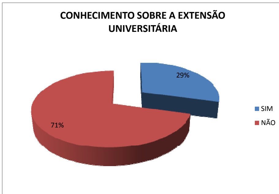
Figura1: Conhecimento sobre a Extensão Universitária.

A figura 1 mostra que 71% dos alunos desconhecem o termo extensão universitária . Grande parte dos alunos entrevistados está em fase de finalização do curso. Através deste fato, evidencia-se que a extensão não é conhecida como deveria, porque o seu conhecimento não é propagado dentro e fora da universidade. Em alguns dos questionários respondidos, obteve-se resposta que a iniciação científica é uma extensão. Desta forma equivocada aduzimos que muitos alunos não conhecem o sentido genuíno de um dos pilares da universidade. Segundo Castro (2010), a extensão produz conhecimento a partir da experiência, por isso se adquire capacidade de narrar sobre o fazer.