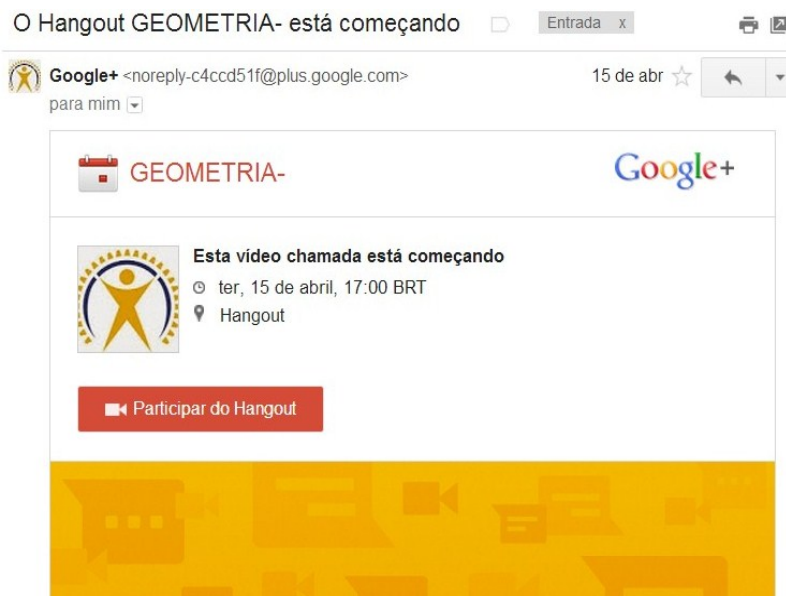
Figura 3: Lembrete de vídeo aula enviado para o e-mail dos convidados

Os mesmos eventos foram confirmados no Google Agenda, onde foi também foi inserido um arquivo em pdf, com a ementa e o cronograma das aulas. A transmissão ao vivo foi configurada a restringir apenas usuários Apps FEAMIG, estabelecendo hora e data, incluindo um anexo com as pautas da vídeo transmissão.