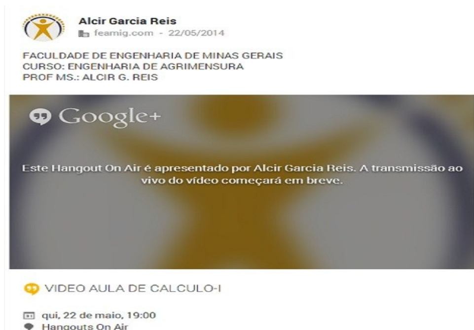
Figura 4: Vídeo aula agendada e aguardando para ser transmitida na plataforma Apps

Através da figura 4, é possível ver a transmissão da vídeo aula de Cálculo I em modo de espera até o momento de início da vídeo aula.