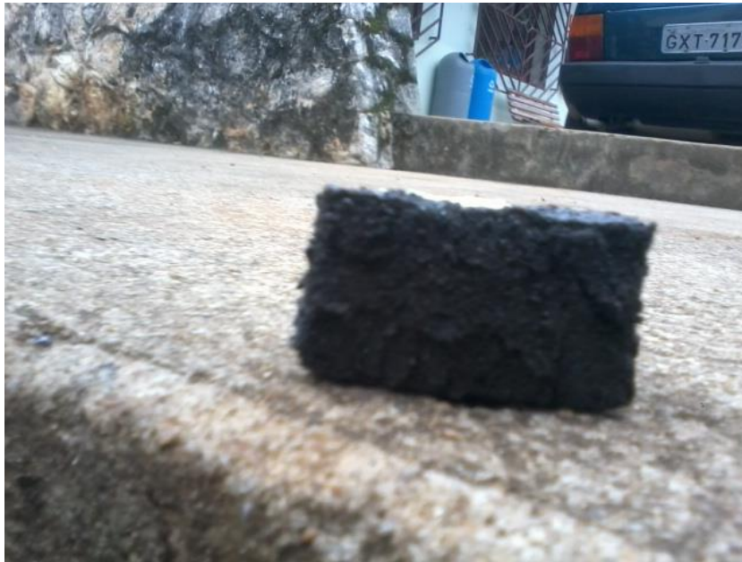
Figura 6 – Pastilha de concentração 70%.

A “Figura 6” mostra a pastilha de concentração 70% de pó metálico e de volume 16 cm 3 feita em molde de metal.