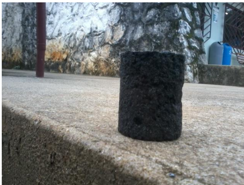
Figura 5 – Pastilha de concentração 80%.

A “Figura 5” mostra a pastilha de concentração 80% de pó metálico e de volume 87,43 cm 3 feita em molde de papelão.