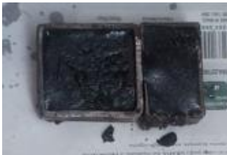
Figura 3 – Pastilhas obtidas de concentração desconhecida.

É conveniente ressaltar, que esse procedimento foi apenas uma tentativa de compactar o pó metálico utilizando para tanto um aditivo. Logo, não houve uma maior preocupação com a proporção do material de base em comparação ao aditivo. A “Figura 3” mostram as pastilhas obtidas.