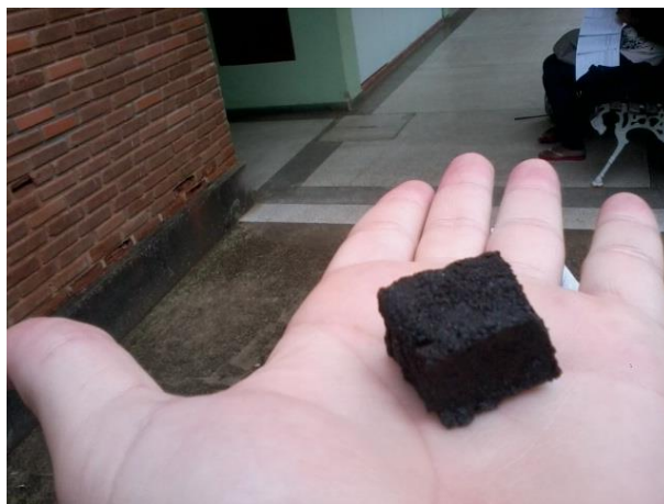
Figura 4 – Pastilha de concentração 90%.

A “Figura 4” mostra a pastilha de concentração 90% de pó metálico e de volume 9 cm 3 feita em molde de metal.