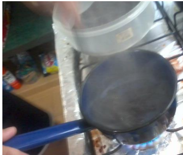
Figura 2 – Processo de aquecimento feito de forma caseira.

Neste procedimento, a cola foi aquecida misturada a um pouco de água, em uma panela comum, até que essa se tornasse líquida e foi adicionado a esta em separado os volumes de pó metálico citados anteriormente. Após 12 horas a pastilha compactada estava em estado sólido e, por conseguinte foi retirada do molde. Por fim, tem-se que a pastilha possui a configuração necessária aos testes de permeabilidade magnética. As pastilhas obtidas possuem elevada resistência mecânica, uma vez que os grãos do pó possuem suficiente aderência entre si devido ao aquecimento deste junto ao aditivo e posterior resfriamento em temperatura ambiente.