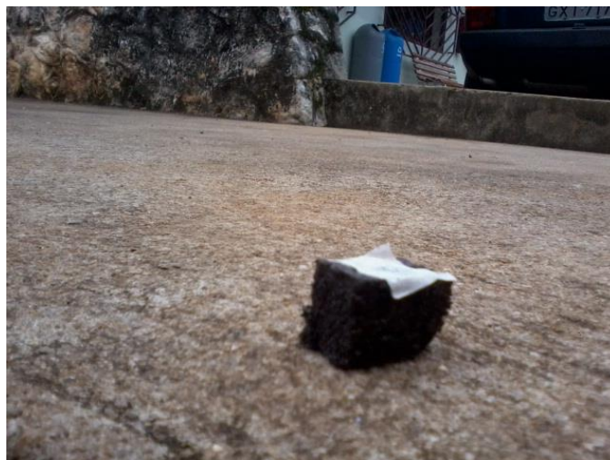
Figura 7 – Pastilha de concentração 50%.

A “Figura 7” mostra a pastilha de concentração 50% de pó metálico e de volume 12 cm 3 feita em molde de metal.