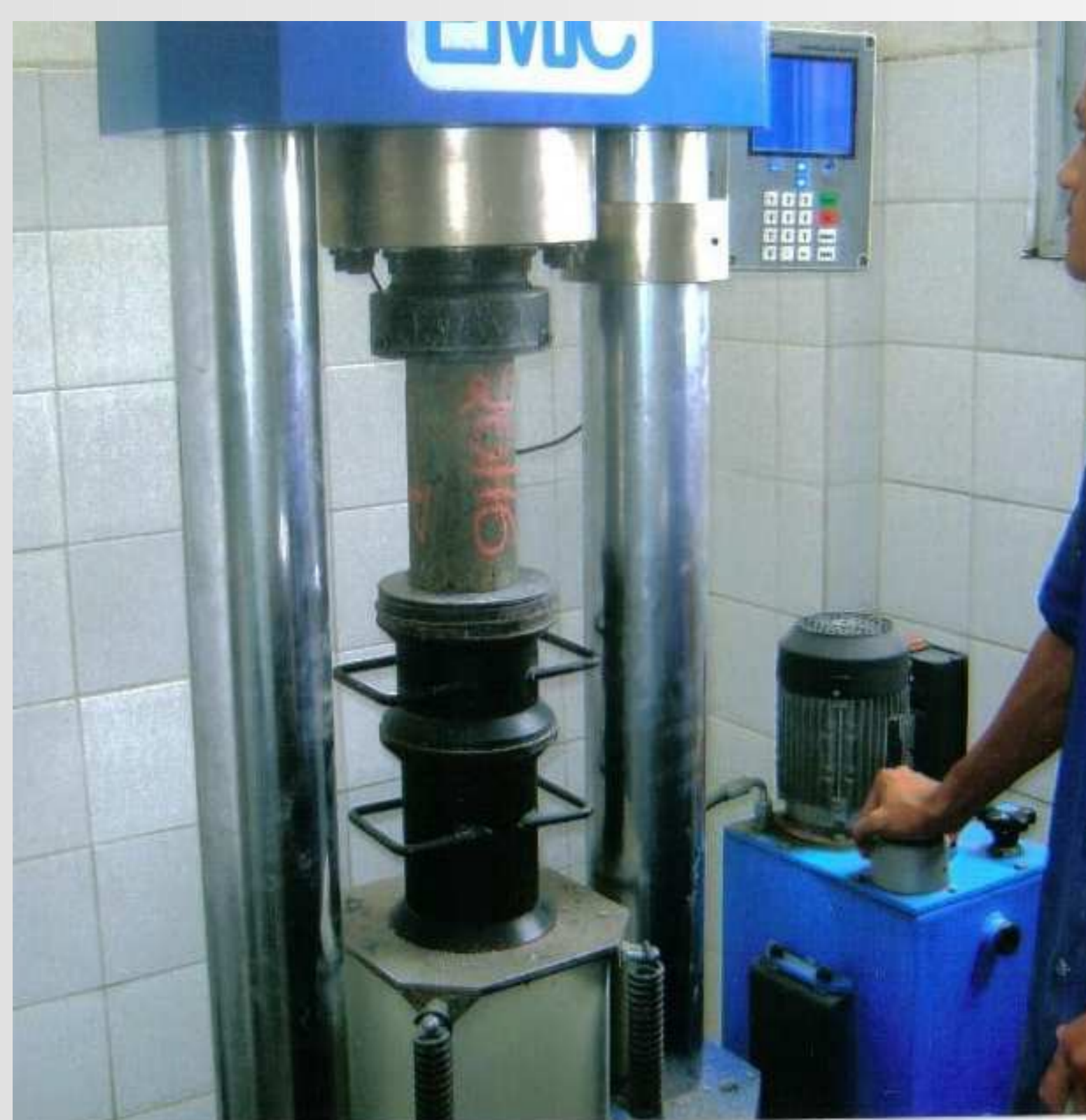
Figura-1: Equipamento para o ensaio de compressão.

Como a resistência do concreto é a capacidade de resistir à tensão sem ruptura foi analisada a ruptura dos corpos de prova nas curas 7, 14, 21 e 28 dias, como pode ser visto na figura (1).