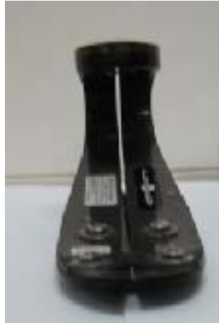
Figura 1 – Vista frontal do pé da prótese

Para a validação dos resultados, também é interessante o desenvolvimento de um dispositivo a partir de um strain gage (extensômetro). Este dispositivo permite o mapeamento da força aplicada pelo coto na superfície de contato da prótese com o paciente, possibilitando desta forma a análise mais precisa das tensões para a modelagem do problema.